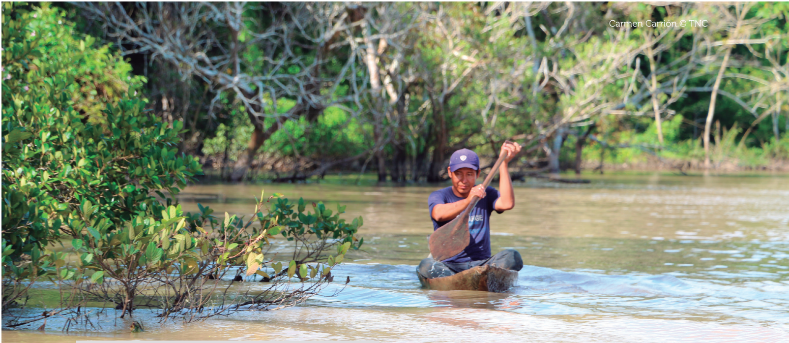
Carmen Carrón © TNC

Para la dimensión de sostenibilidad ambiental , el MEF formuló y utilizó cinco indicadores en la metodología de priorización de proyectos para el PNISC: