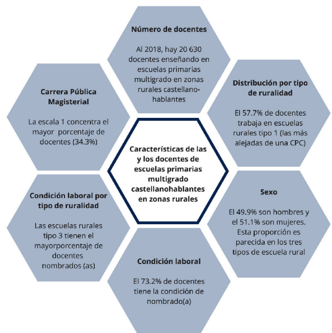
Gráfico 2. Características de las y los docentes de escuelas primarias multigrado castellanohablantes en zonas rurales