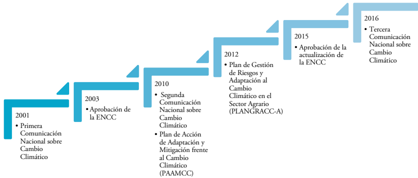
Ilustración 1 Documentos nacionales sobre la gestión del cambio climático y su adaptación