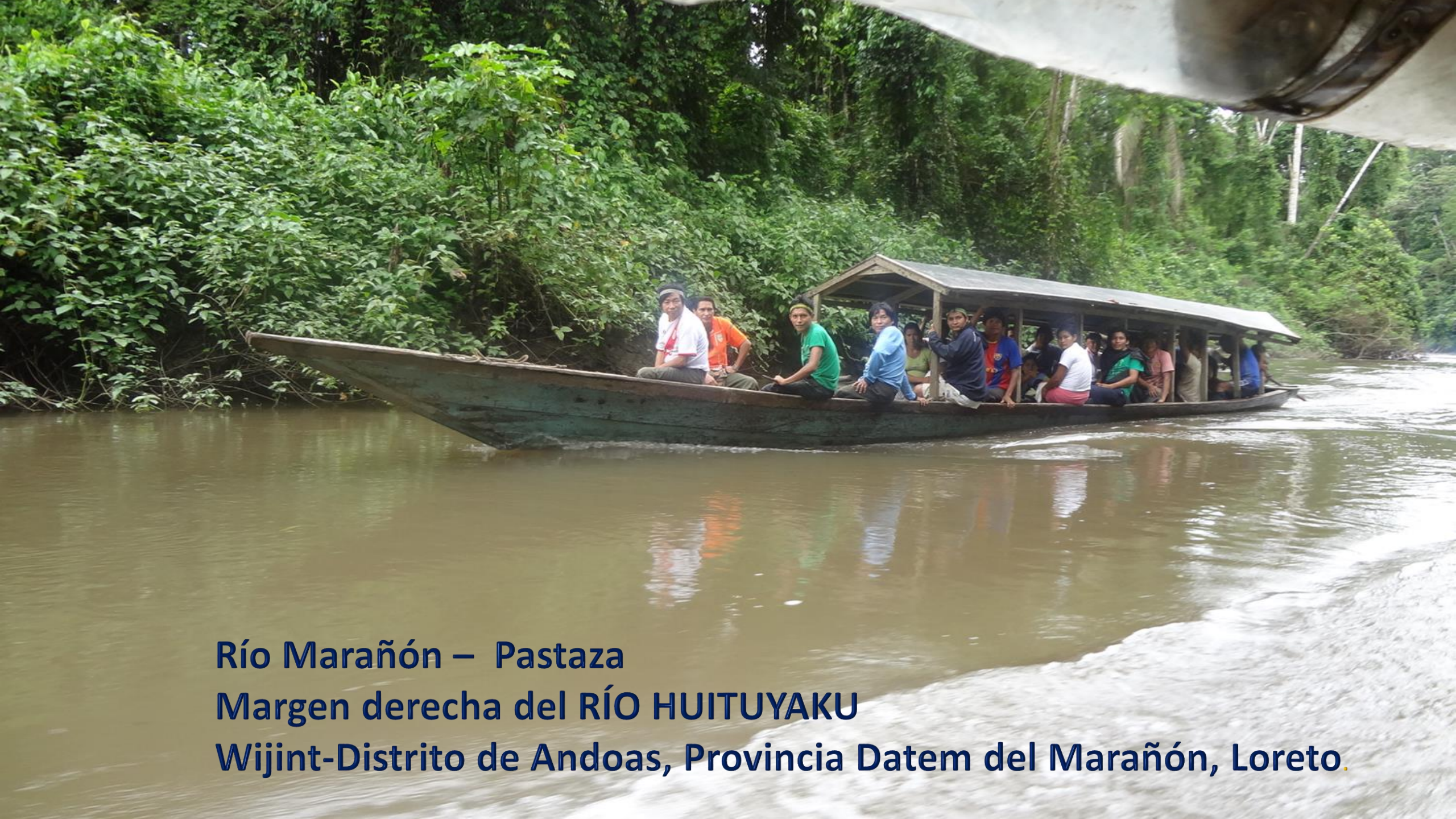
Río Marañón – Pastaza Margen derecha del RÍO HUITUYAKU Wijint-Distrito de Andoas, Provincia Datem del Marañón, Loreto.